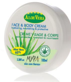
Crème visage & corps 100 ml

Enrichie en vitamines et contenant 50% d'Aloe Vera, cette crème lisse et hydrate immédiatement les mains et les ongles pour un effet durable.