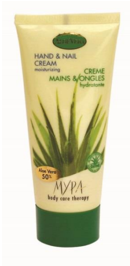
Crème hydratante mains & ongles 100ml

Enrichie en vitamines et contenant 50% d'Aloe Vera, cette crème lisse et hydrate immédiatement les mains et les ongles pour un effet durable.